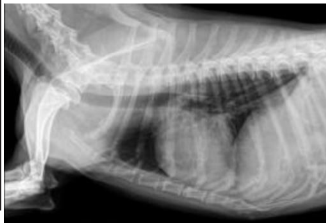
Figura 2. Imagem radiográfica torácica em projeção látero-lateral direita de cão, SRD, com 5 anos de idade, após toracocentese. Note a redução da radioluscência e preservação da silhueta cardíaca.

Optou-se pela oxigenioterapia via máscara, na taxa de 0,5L/h, seguida pela drenagem do tórax por meio de cateter 22 G e circuito fechado com seringa de três vias, sendo drenado cerca de 1 litro de ar. Optou-se por não sedar o paciente, uma vez que o mesmo mantinha-se permitindo o procedimento e sem cianose, neste momento. Após a toracocentese, o paciente mantinha-se em dispneia, sem redução do padrão radiográfico (Figura 2) compatível com resolução esperada após a drenagem. Foi realizada hemogasometria arterial e os valores foram compatíveis com acidose metabólica (pH plasmático 6,8 e \text{HCO}_3 18mEq/L). Para estabilização do quadro o paciente foi mantido em oxigenoterapia, agora sendo passada sonda nasal, e foi realizada fluidoterapia de reposição e manutenção com Ringer lactato (taxa de 400 ml/8h e 15 ml/hora, respectivamente), e o paciente manteve-se estável, entretanto, devido o quadro grave, veio a óbito na manhã seguinte.