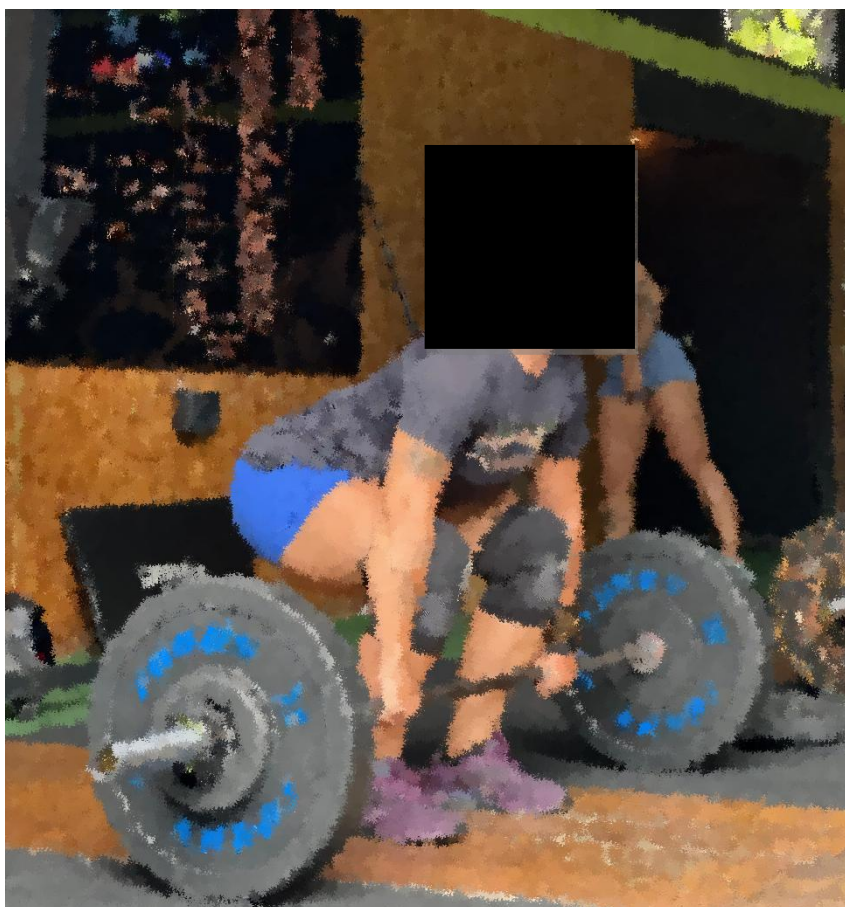
Figura 2 – Atleta em um exercício com a barra olímpica