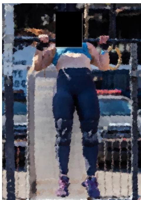
Figura 3 – Atleta em um exercício com a barra olímpica

Dentro do contexto brasileiro, observa-se a existência de um circuito expressivo de competições amadoras de Crosstraining , com abrangência regional e nacional, que anualmente mobiliza milhares praticantes e entusiastas da modalidade. Tais eventos, embora frequentemente adotem metodologias e formatos inspirados no modelo do CrossFit ® , não mantêm vínculos formais com a marca, tampouco são supervisionados por uma federação ou confederação nacional que estabeleça diretrizes normativas ou padronizações técnicas. Em decorrência disso, o cenário competitivo no Brasil se caracteriza por uma ampla diversidade, manifestada na variedade de campeonatos quanto à escala, nível de exigência e qualidade técnica, aspectos fortemente influenciados pela estrutura organizacional e pelos recursos disponíveis em cada localidade.